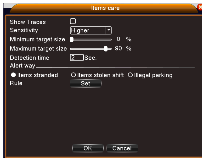
Рис 3 Установка правил – Элементы тревоги