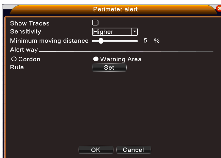
Рис 2 Настройка правила - кордон